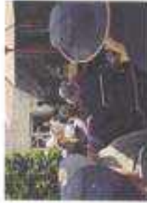
Teatro - A Manhã