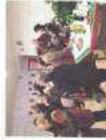
Janeiras - USTAG