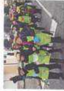
Desfile de Carnaval