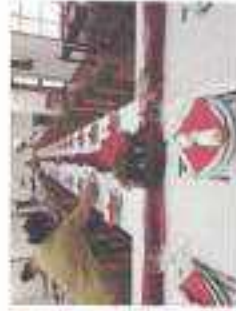
Ceia de Natal